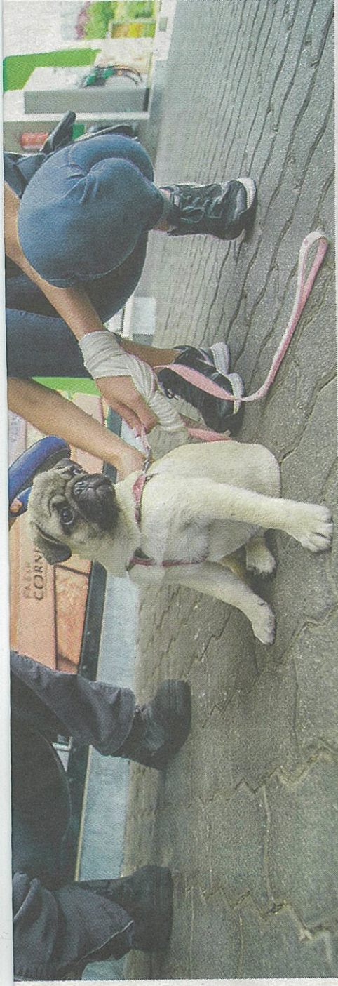
A MOL országoserte bővíti chipleolvasó szolgáltatását, Baranyában Mohácson és Szigetváron van leolvasójuk eddig

A magyar olaj- és gázipari vállalat, a MOL a Vigyél Haza Alapítvánnyal karöltve bővíti állatbarát szolgáltatását. A vállalat ötven töltőállomáson helyezi ki olyan mikrochip-leolvasókat, amelyek az elköborolt kutyák hazajutását segítik. Baranyában négy helyen van lehetőség a kóbor ebek ingyenes azonosítására.